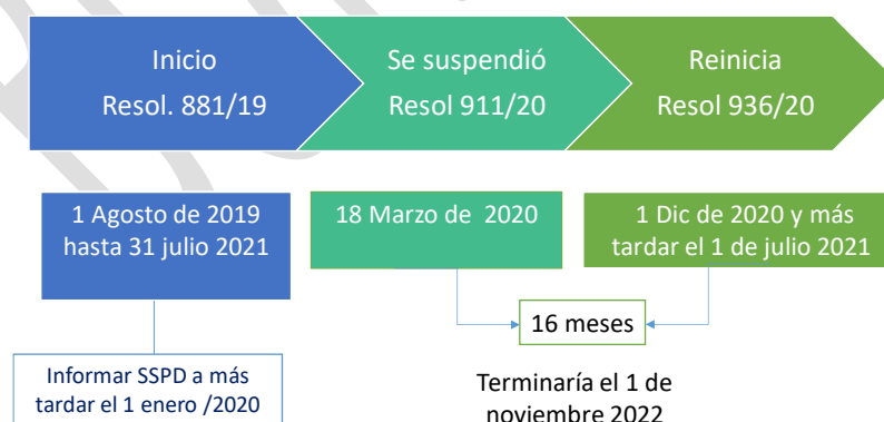
Gráfica 1. Análisis del plazo de la progresividad para los pequeños prestadores de los servicios de acueducto y alcantarillado

Teniendo en cuenta que por efecto de la suspensión del plazo de progresividad previsto en la Resolución CRA 881 de 2019, compilada en la Resolución CRA 943 de 2021, y la reanudación de su aplicación a partir del 1 de diciembre de 2020 y a más tardar el 1 de julio de 2021, el tiempo en que se entendería suspendida la aplicación de la progresividad por parte de las personas prestadoras, fue entre 8 meses y 16 meses, para lo cual, este último plazo de progresividad termina el 1 de noviembre de 2022.